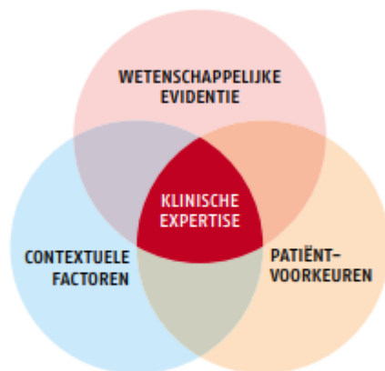
Principes van evidence-based practice