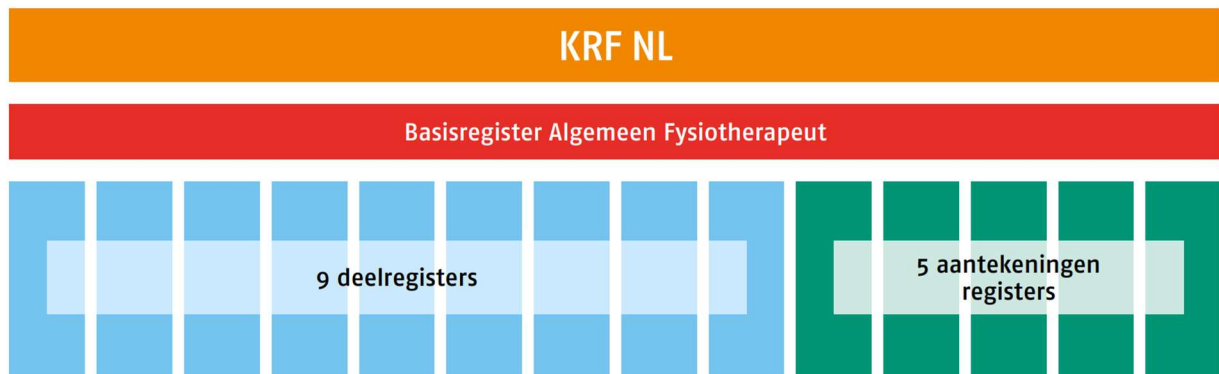
Figuur 1: Schematische weergave van de opbouw van de registers binnen KRF NL

Het KRF NL bestaat uit het Basisregister Algemeen Fysiotherapeut, Deelregisters en Aantekeningenregisters (zie Figuur 1).